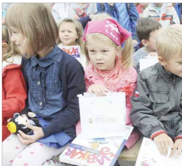
Prváci so šlabikármí.

né údaje zákonných zástupcov, preto si musia so sebou zobrať občiansky preukaz a rodný list dieťaťa. Pedagógovia formou rozhovoru a na základe výtvarného vyjadrenia skúmajú psychické, fyzické a sociálne schopnosti dieťaťa, napríklad, ako si dieťa dokáže poradiť s rozpoznávaním farieb, geometrických tvarov, orientovať sa v priestore, spočítať predmety do päť, či aké má komunikačné schopnosti. Na základe