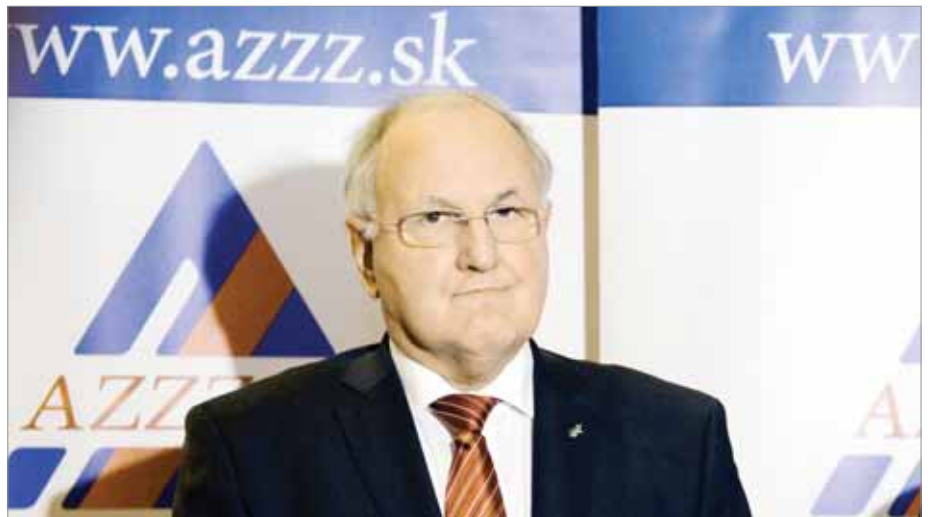
Minister školstva Dušan Čaplovič.