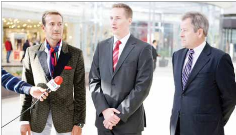
So starostom mesta Konstanca a CEO Immofinanz pri otvorení nákupného strediska.

V pondelok väčšinou idem do Viedne, kde je sídlo našej spoločnosti a nočným letom sa potom presúvam do Moskvy. Do piatka som plne vyťažený, venujem sa práci priemerne 12 – 14 hodín