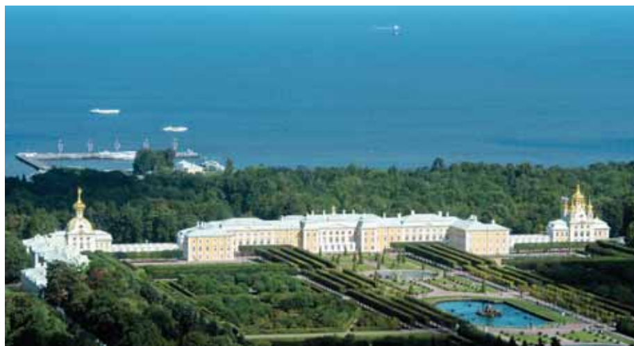
Letecký pohľad na palác Petrodvorec v Petrohrade.

Paškova delegácia pricestovala na oficiálnu návštevu Ruska v stredu večer 5. februára. Počas návštevy absolvoval Paška sé-