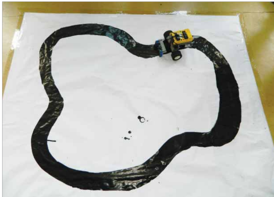
Auto vyhľadávajúce čiernu čiaru.

Poslednou zastávkou v rámci spoznávania tejto zaujímavej