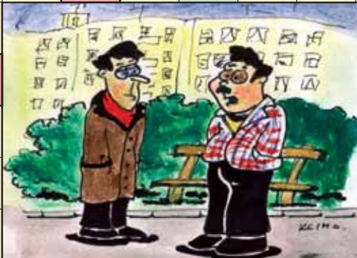
- Povedal si svojej žene, že k vám prídem v nedeľu na obed?