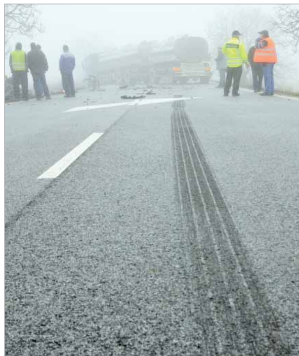
Ostražitosti za volantom nie je nikdy dost.

nie je nikdy dost. Dokazujú to nehody, ktoré vznikajú v dôsledku občasného primrzania vozovky. Kritické sú nočné hodiny a skoré rána. Na zamrzutej ceste nepomôže vodičovi, ktorý neprispôsobí rýchlosť jazdy stavu a povahe vozovky, ani posyp. Ten môže kontraproduktívne pôsobiť hlavne na suchej ceste, keď vodič v zákrute v domnienke, že je sucho a pomerne teplo, neráta s posypanou cestou a na drobnej súvislej vrstve kamienkov