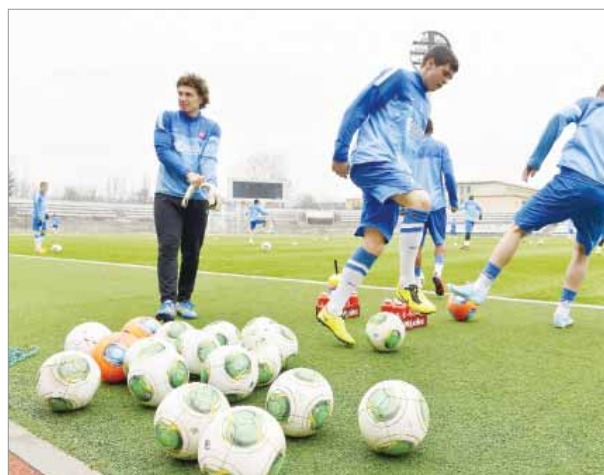
Corgoňliga nepatrí do najlepšej 50 svetových líg.