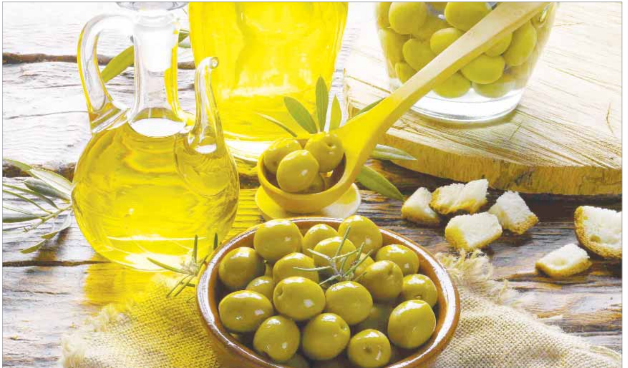
Úplné vylúčenie tukov z jedálnička je veľkou chybou.

Na tému tuky v strave sa už napísalo všeličo, ale všeobecný záver o ich škodlivosti pre náš organizmus najnovšie už neplatí. Podľa odborníkov na zdravú výživu úplné vylúčenie tukov z jedálnička je veľkou chybou. Dôležitejšie je, vedieť si ustrážiť ich množstvo a tiež správne tuky vyberať. Tuky by mali tvoriť 25 až 30 percent celkového denného energetického príjmu. Na pozore sa treba mať