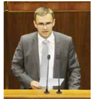
Poslanec Martin Fedor.