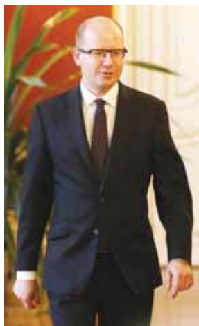
Český premiér Bohuslav Sobotka.