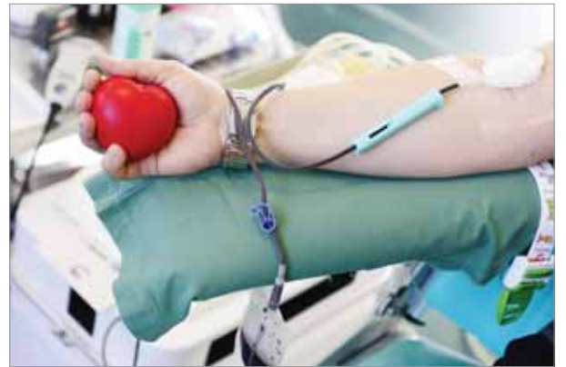
TASR Ilustračné