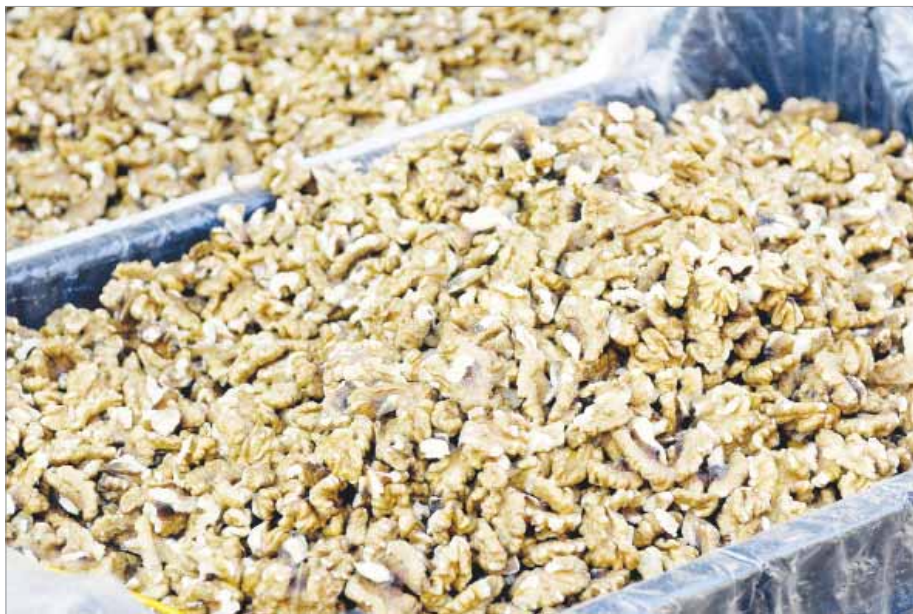
Vlašský orech je zdrojom výživy a energie pre mozog.