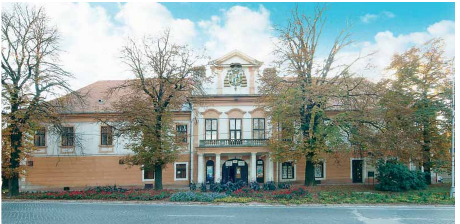
Renesančný kaštieľ.

str. 12 Na tému tuky v strave sa už napísalo všeličo, ale všeobecný záver o ich škodlivosti pre náš organizmus najnovšie neplatí.