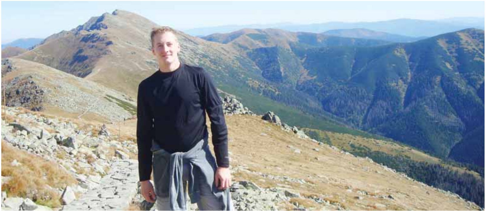
Najlepšie miesto na relax je v slovenských horách.